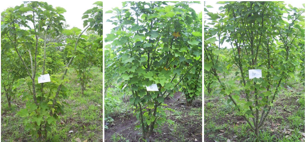
Gambar 2. Sosok tanaman jarak pagar genotipe Lombok Barat asal biji (kiri), stek (tengah), dan biji yang kemudian dipangkas (kanan) saat berumur satu tahun setelah pindah tanam.